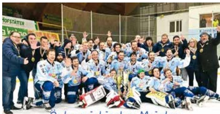
Österreichischer Meister Kärntner Meister 2022/23