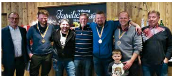
Gewinner Platz 3