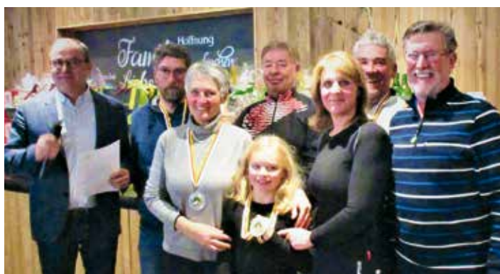
Gewinner Platz 2