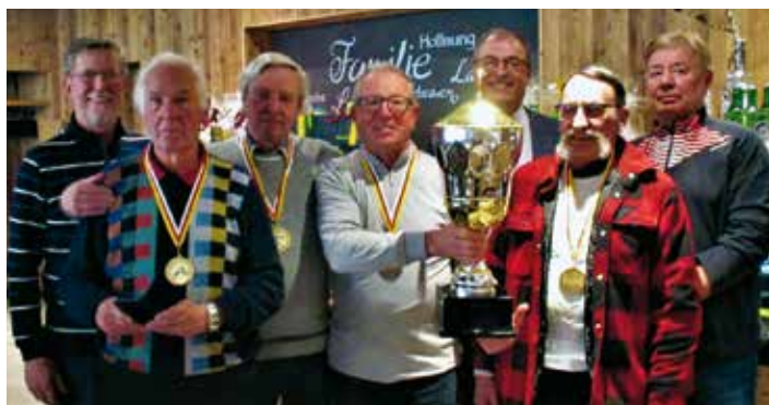
Gewinner Platz 1