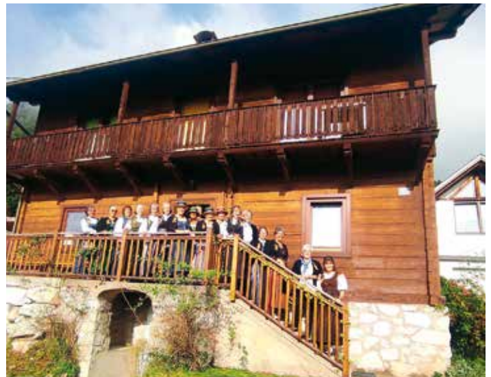
Erntedankfest veranstaltet von der Trachtengruppe Bodensdorf