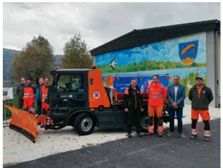
Vorstellung und Einschulung des neuen Kommunalfahrzeuges